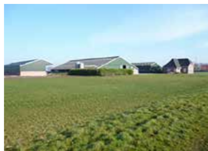
NoorderlandMelk steunt Stichting 'De Boer op Noord'