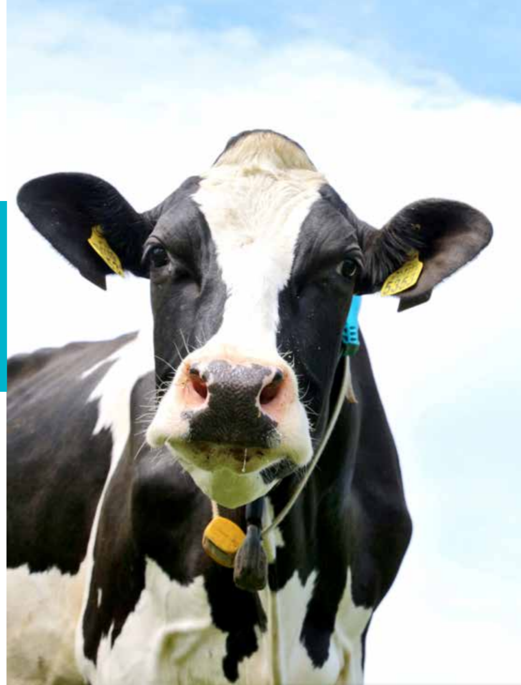
'Wij maken de melk met liefde voor ons vee!'

In hoofdstuk 1 komen een aantal onderdelen van het NGP terug, dierzieketestatussen, levensduur, antibioticagebruik en Koekompas. Het Koekompas komt in de plaats van het NGP en het PBB. Komend jaar (2016) is