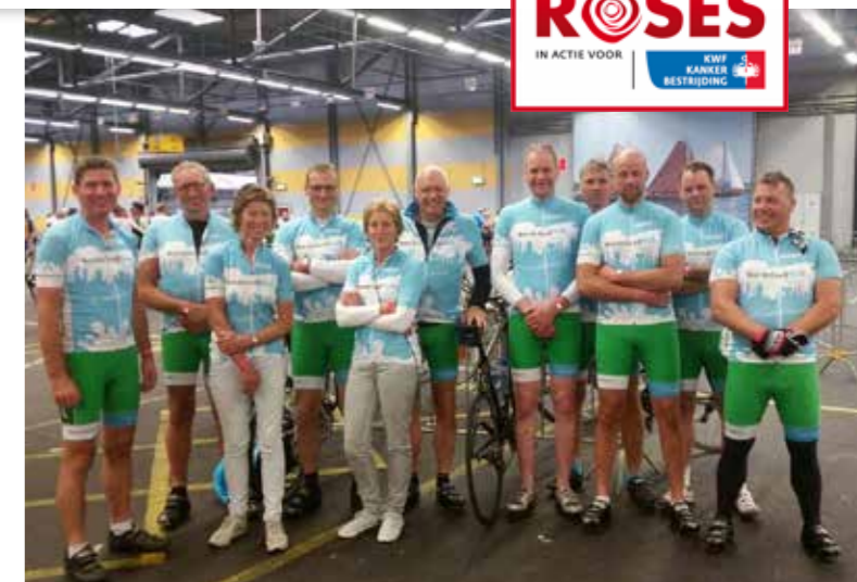
'Samen strijden tegen kanker.'